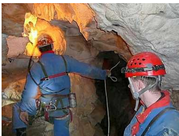
Sestup do propasti