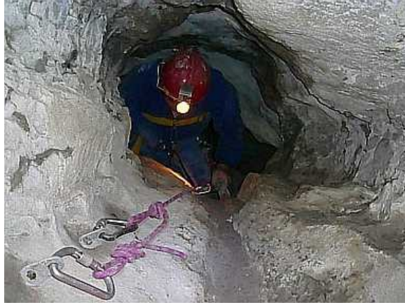
Téměř na povrchu