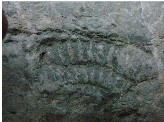
Fosílie z Belianského potoka