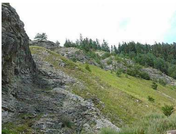
Před Belianskou dolinou