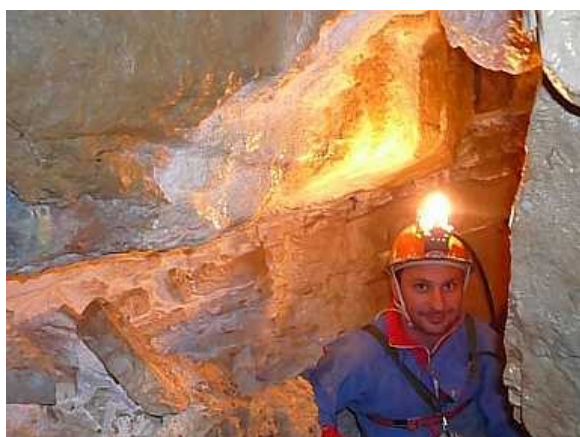
Jáno v Jazierkové chodbě